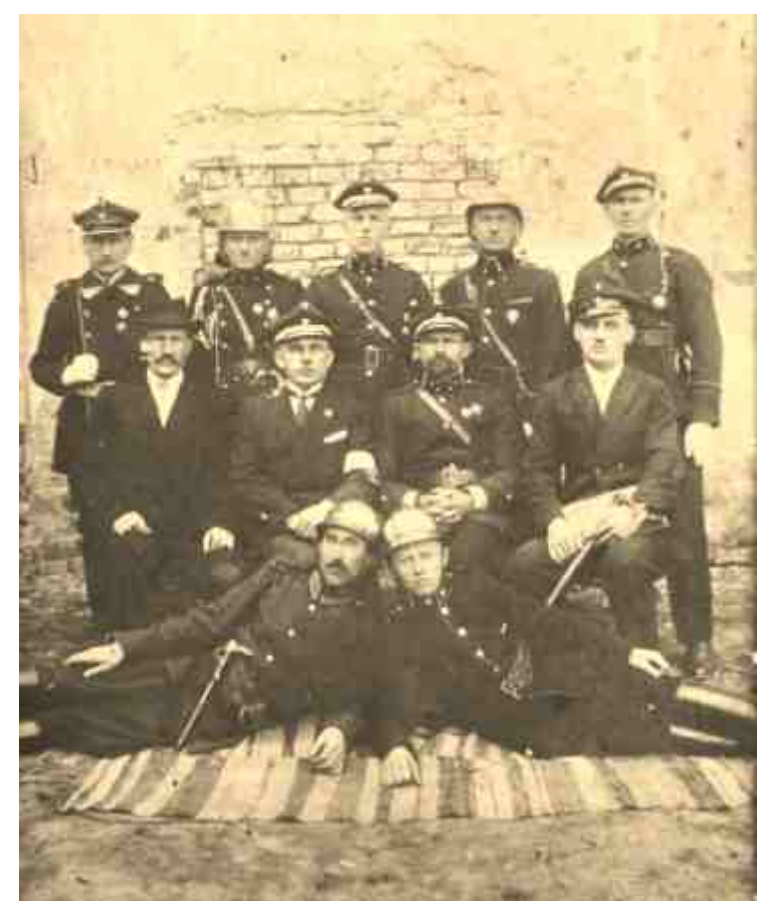
Zarząd i rada sztabowa Ch.O.S.O. Zdjęcie z 1927

Dopiero po przemianach demokratycznych w latach 90-tych Ochotnicze Straże Pożarne uzyskały możliwość tworzenia własnych statutów. Skorzystała z tego również choroska straż, tworząc Uchwałą nr 3/93 Walnego Zebrania Stowarzyszenia OSP w Choroszczy z dn. 12 lutego 1993 roku nowy, własny statut.