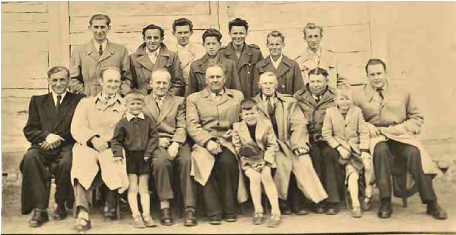
Zarząd OSP w Choroszcz, grupa młodzieżowa i najmłodszy sympatycy Ochotniczej Straży Pożarnej w Choroszcz w 1960 r.