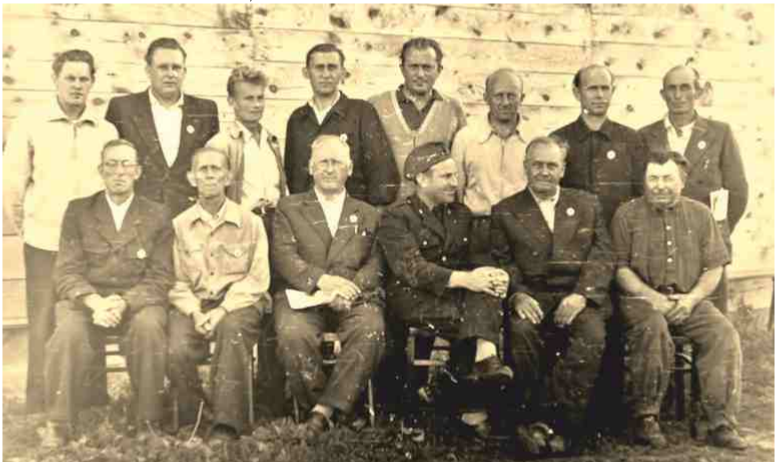
Zarząd Ochotniczej Straży Pożarnej w Choroszczy wraz z sekcją młodzieżową - lata 50.